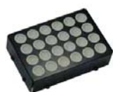
4mLバイアル用カセット