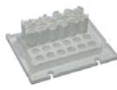
エッペンドルフチューブ アダプターおよびカセット